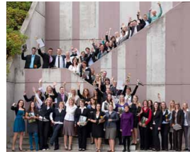
Geschäft! Absolventinnen und Absolventen des Fachbereichs Wirtschaftswissenschaften halten endlich ihre Abschlusszeugnisse in den Händen.

Feierliche Exmatrikulation am Fachbereich Wirtschaftswissenschaften