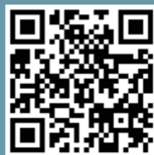
QR-Code zum selbst ausprobieren!