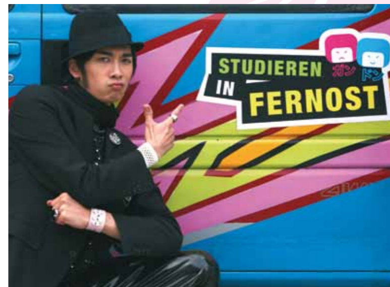
Darsteller „Gang“ in einem zentralen Bild der Kampagne

Die Kampagne, finanziert durch das Bundesministerium für Bildung und Forschung (BMBF), wird zunächst bis einschließlich 2012 fortgeführt und hilft hoffentlich ein paar längst überholte Vorurteile abzubauen! Denn warum in die Ferne reisen, der Osten liegt so nah! ▶