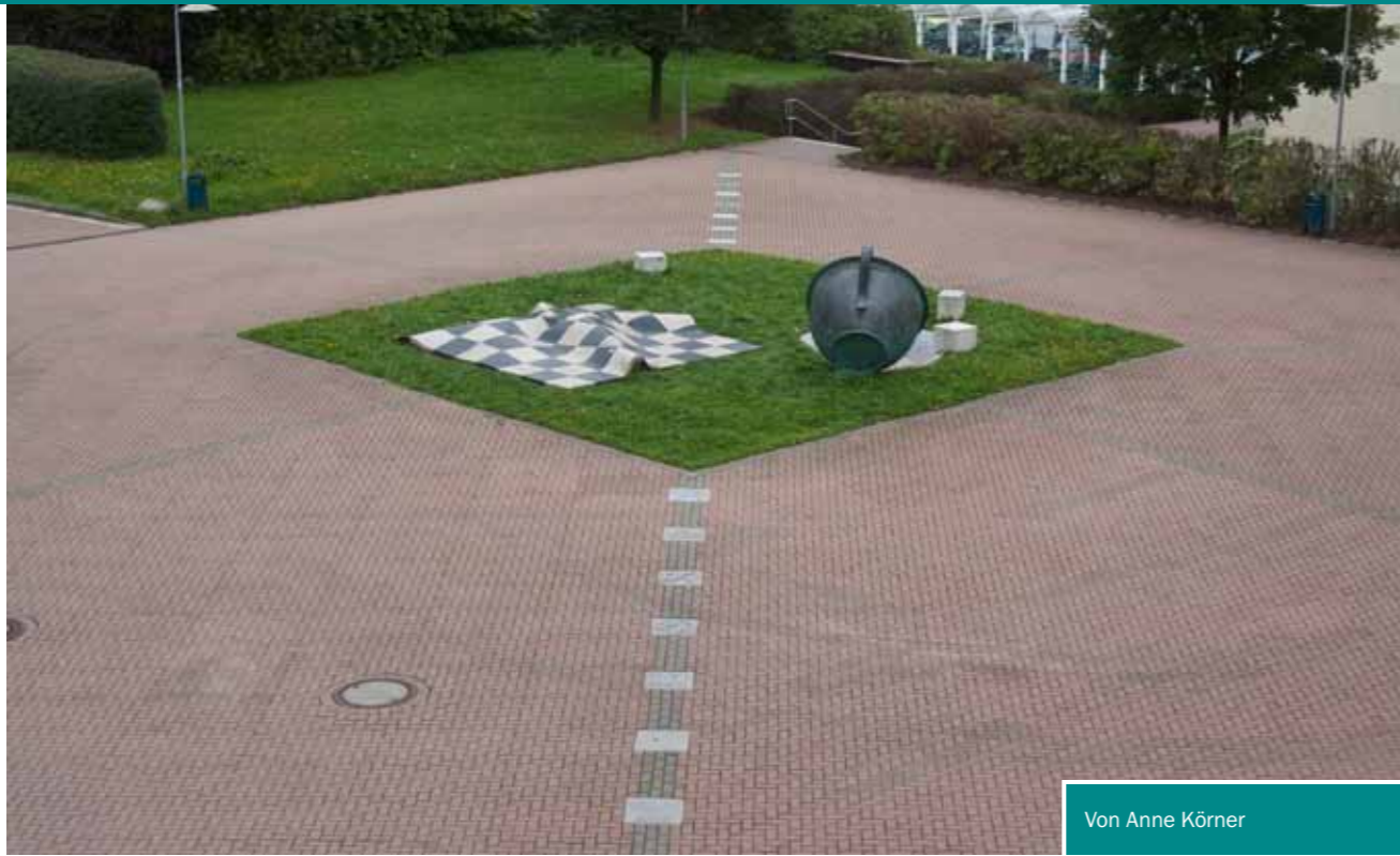
Von Anne Körner