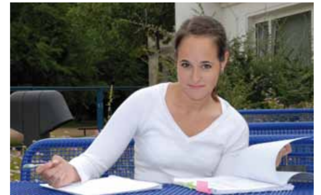
Wenn die Prüfungen nahen, gilt für die meisten Studenten: büffeln, büffeln, büffeln. Oft jedoch hemmt die Angst vor der Klausur oder der Termindruck vor Abgabeschluss der Hausarbeiten die Kreativität.

Felser: Ein Verständnis dafür, wie unsere Interpretation der Umwelt zu unserem Befinden beiträgt. Menschen sind erfolgreicher, wenn sie sich ein positives Ziel setzen. Prüfungsangst geht ja oft mit dem Gedanken einher ‚bloß nicht durchfallen‘, also einem negativ formulierten Ziel. Dies ist weniger motivierend als eine positive Formulierung, wie z.B. ‚Ich will mindestens die Note 2 erreichen‘.