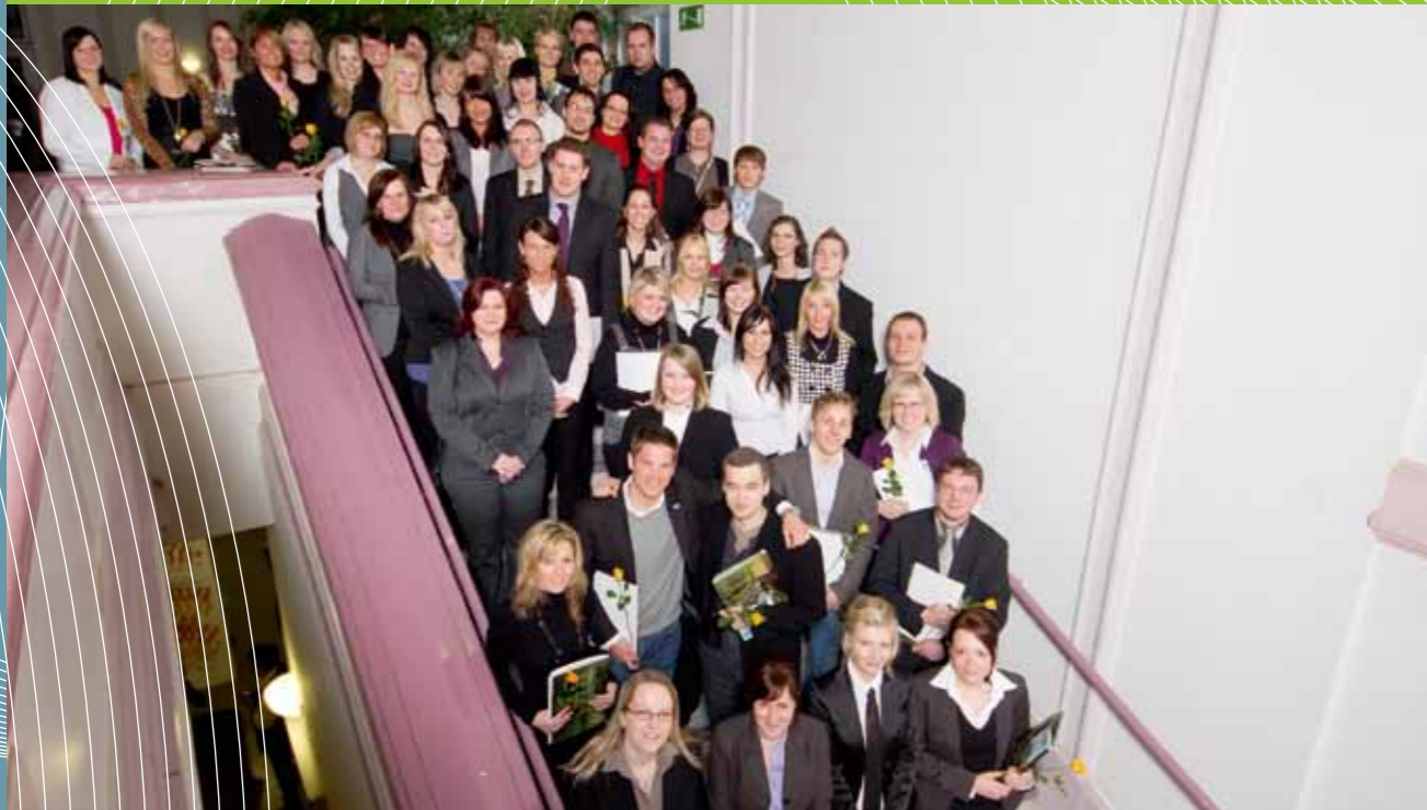
Feierliche Übergabe der Abschlusszeugnisse an die Absolventinnen und Absolventen des Fachbereichs Verwaltungswissenschaften am 26. November 2010