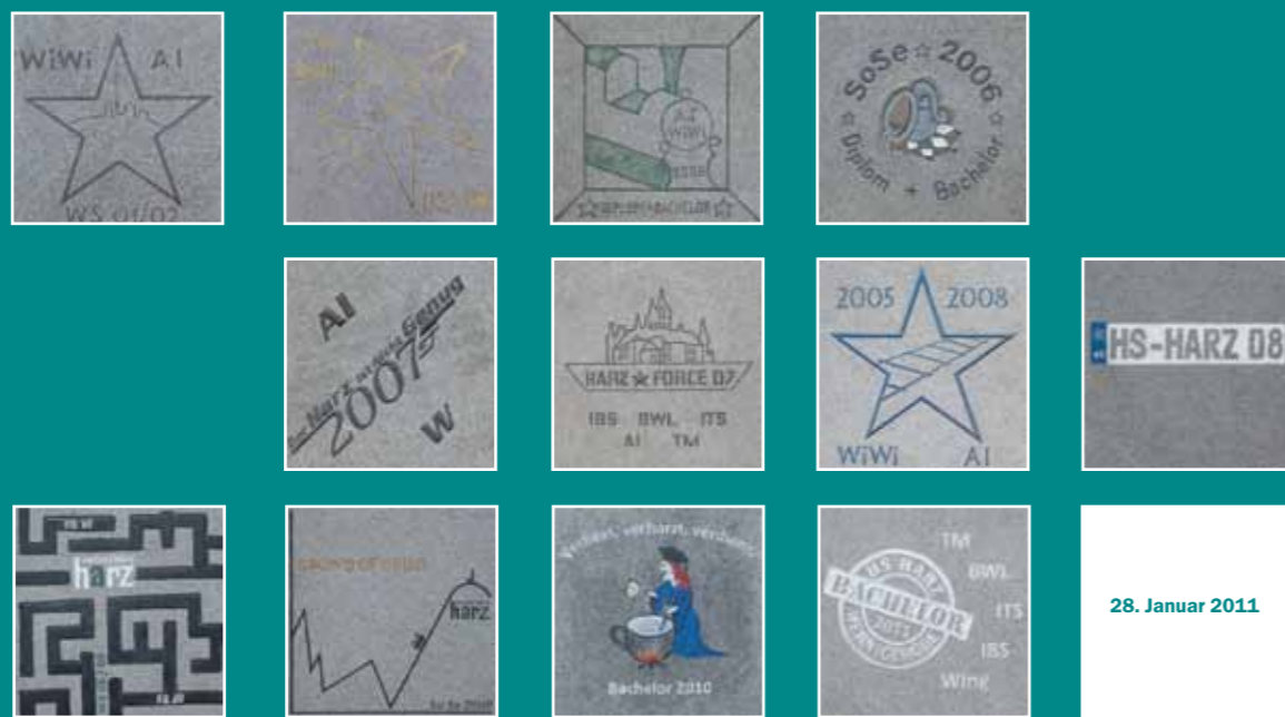
28. Januar 2011

Die Studienzeit gilt oft als schönste Zeit im Leben. Doch auch sie geht einmal vorbei. Als Erinnerung setzen die Studenten des Abschlusssemesters zweimal im Jahr ein Zeichen – einen Stern auf dem „Walk of Fame“. Seit 1992 besteht die Tradition unter den Absolventen, der Hochschule ein Geschenk zu hinterlassen, sei es in Form von diversen Skulpturen oder Bäumen. Um eine zentrale Plattform zu schaffen, wurde 2005 der „Walk of Fame“ eingeweiht. Während die Größen der amerikanischen Unterhaltungsindustrie ihren Platz in Hollywood einnehmen, verewigen sich die Absolventen der Hochschule Harz in gleicher Manier auf dem Wernigeröder Campus. Jedes Abschlusssemester gestaltet ganz individuell eine Steinplatte, die während einer feierlichen Zeremonie zweimal im Jahr in den Boden eingelassen wird. Zwölf Platten zieren bereits den „Roten Platz“. Die nächste Steinlegung findet am 28. Januar 2011 statt.