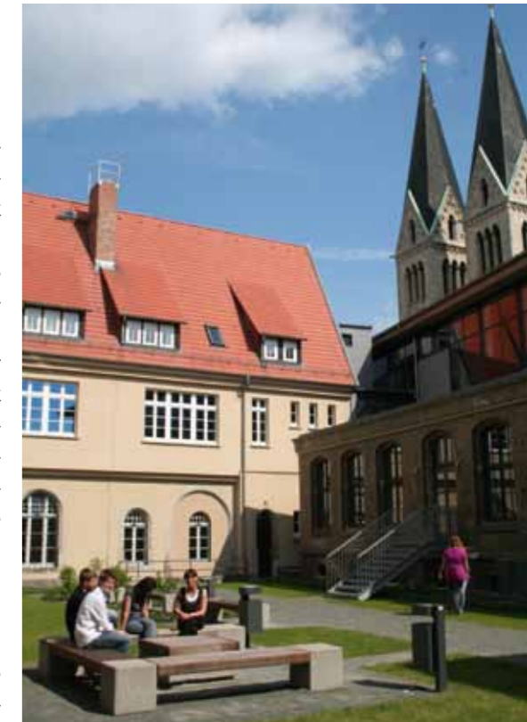
Historisches Ambiente auf dem Halberstädter Campus

Die Dompropstei vervollkommnet den Dreiklang. Seit 1813 durch die Stadtverwaltung genutzt, musste das Gebäude nach der Teilerstörung im zweiten Weltkrieg wiederaufgebaut werden. Mit dem Abschluss der Sanierung für den Einzug der Hochschule Harz erstrahlen die historische Fachwerkfassade, die steinernen Arkaden und die Wappenreliefs der Domherren seither in neuem Glanz. Die