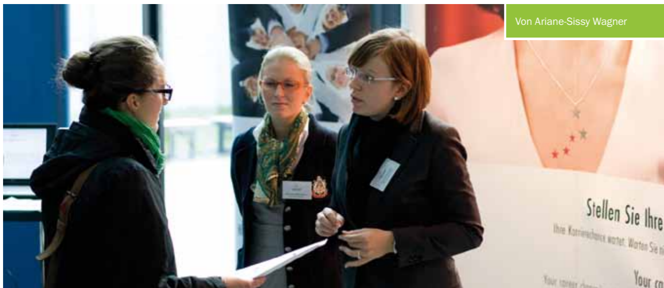
Von Ariane-Sissy Wagner

Zahlreiche Studierende nutzten zur Firmenkontaktmesse die Gelegenheit, mit unterschiedlichsten Unternehmensvertretern zu sprechen und den Berufseinstieg professionell vorzubereiten.