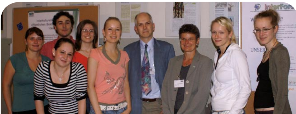
Informationsstand des Fachbereichs Verwaltungswissenschaften beim „Tag gegen Rechts“